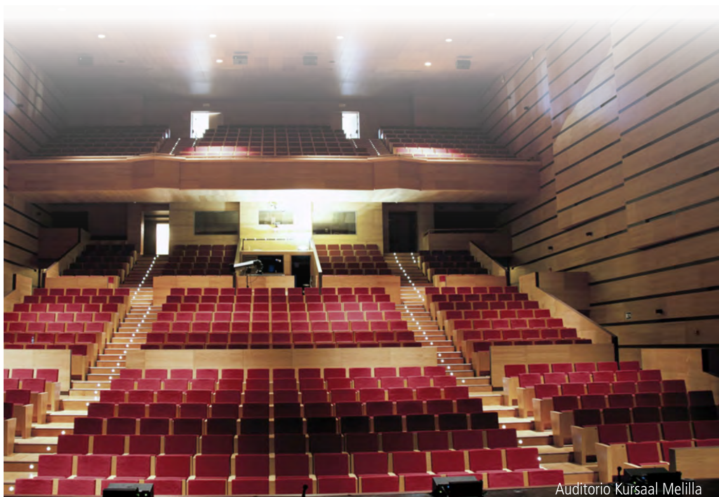
Auditorio Kursaal Melilla