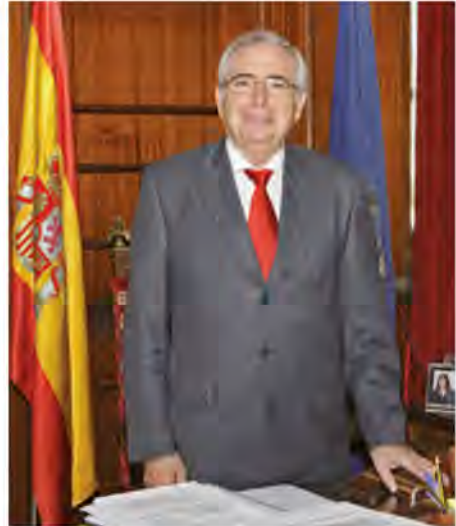
Juan José Imbroda Ortiz Presidente

La mediterránea y española ciudad de Melilla encierra un incalculable tesoro cultural, que la hace grande ante el mundo, por pequeña que sea su sombra entre los gigantes de Oriente y Occidente, casi imperceptible pedazo de Europa en el norte de África, pero tierra y testigo de las más antiguas civilizaciones del mundo.